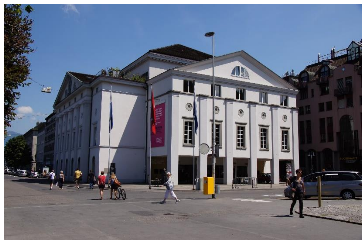
Wie sieht die Zukunft des Luzerner Theaters aus?