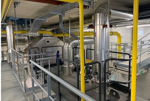
Klares Bergwasser für die Städter