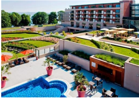
Hotel Hilton Evian-les-Bains