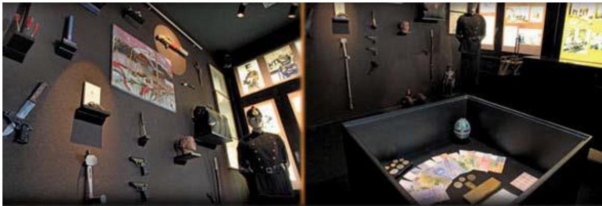
Polizeimuseum – ein Besuch mit Gänsehaut-Effekt